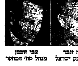
אליהו שפי, מנהל כללי בנק ישראל